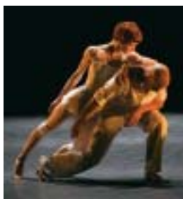
Sylvie Guillem e Russell Malyphant in un passo di Push