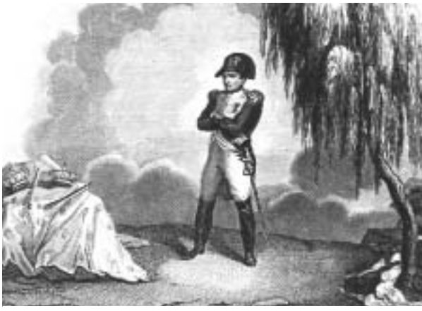
Napoleone in un'incisione dal libro di Antonucci Eustachio, Le sventure di Napoleone. Poesie . Stamperia De Marco, Napoli 1841

1814. Isola d'Elba. Napoleone arriva nell'isola per trascorrere il suo esilio e la popolazione, per la verità un po' piedistallo, trattandolo come in dio. Una volta sistematosi, l'impe-