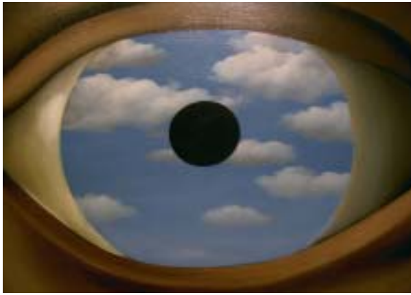
René Magritte (1898-1967), Il falso specchio, 1929 (New York, Museo d'Arte moderna)

La creazione di uno standard Si può andare oltre. Gates ha saputo applicare al meglio le intuizioni proprie e altrui: infischandosi delle hardware, dei macchinari, e tutto sommato anche della qualità assoluta del software, per inseguire invece l'obiettivo che si sarebbe rivelato alla