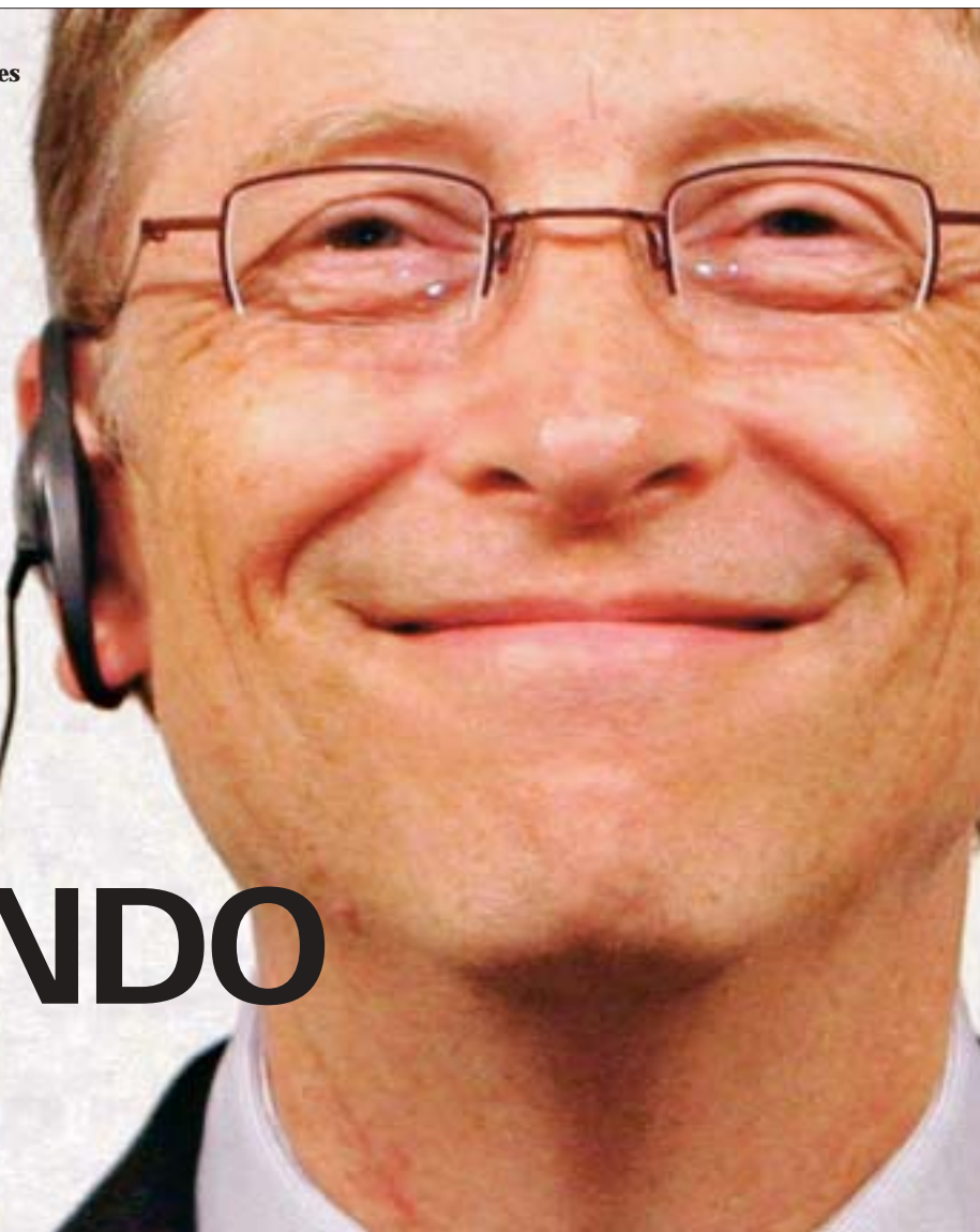
SPR. FRANCE. KOBUCHI