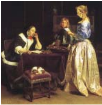
Gerard ter Borch (1617-1681), Donna che legge una lettera (part.), 1660-62, olio su tela, Londra, Royal Collection

Profonda passione per l'uomo propria del popolo russo (la Némirowsky è nata a Kiev), senso di sradicamento degli ebrei (muore ad Auschwitz) e finezza psicologica di una donna forte e sensibile. Questa è Irène Némirowsky. Che con sbalordita semplicità di sguardo e con una prosa essenziale e vibrante, senza commenti né artifici, fa muovere e parlare i suoi personaggi secondo il loro ritmo interiore. Facendone emergere le contraddizioni. Che sono poi quelle del cuore umano. Quello che interessa alla Némirowsky è rappresentare la «commedia che è spettacolo della realtà di tutti i giorni». Le cose, le persone, la vita. Con tutto il bagaglio di colpe e redenzioni, della storia collettiva e di quella individuale. Dove il respiro della vita si fa epico, nella fiamma di solfati nel tolstojano Temporale di giugno di Suite francese , fra cui il giovane Hubert che diventa adulto così: «Aveva acquistato una ricca esperienza; adesso sapeva, e non più in modo astratto, libresco, ma con i battiti folli del suo cuore, con le mani scorticte nella difesa del ponte di Moulins, con la labbra che avevano baciato una donna [...] Sapeva che cosa significassero le parole pericolo, coraggio, paura, amore [...]. Giunse lentamente le mani, chinò la testa e, finalmente, pregò. »