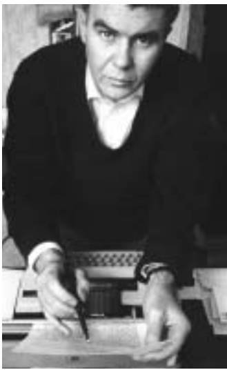
di Davide Brullo

Lo ammettiamo: Raymond non ci è mai andato giù del tutto. Eppure, i suoi libri non fanno una grinza. Ora che minimum fax ne raccoglie l'immane opera poetica quasi quasi lo mettiamo assieme ai santi