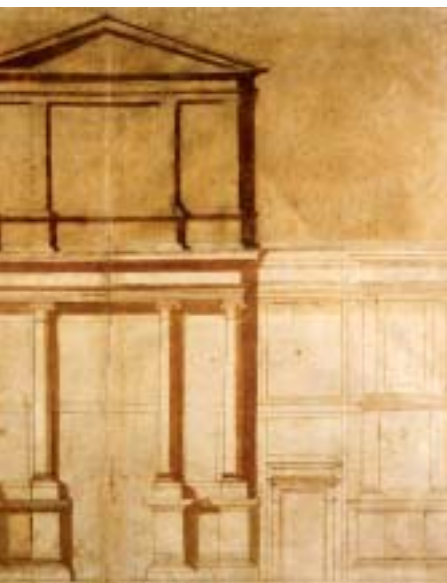
Qui sopra: Primo progetto per la facciata di San Lorenzo, 1516, Firenze, Casa Buonarroti. In basso a destra: Basi di pilastro per la Sagrestia Nuova (con scritto autografo), 1524, Firenze, Casa Buonarroti

Il lavoro cominciò e s'interuppe, come è noto. Michelangelo andò a cercarsi il marmo, a Carrara, ma il Papa lo fermò. «Che io non seguitassi più l'opera sopraddetta - chiese il Papa - perché dicevono volermi torre questa noia del condurre e marmi, e me lo volevano dare in Firenze loro...».