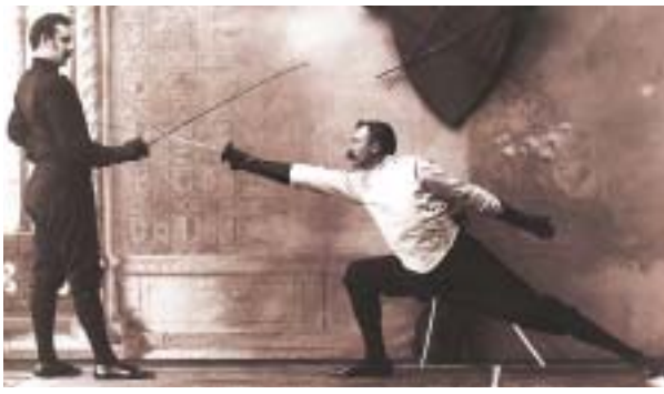
Schermini (1893) in allenamento, stampa moderna da negativo originale su lastra

colò Machiavelli il quale non soltanto stabilisce ormai la superiorità in campo militare della fanteria sulla cavalleria (cioè di una classe sociale più bassa rispetto a quella che accede ai ranghi cavallereschi e che pratica il duello), ma soprattutto ravvisa un pericolo al potere costituito, in quanto il duello permette una giustizia personale al di là delle leggi. Ugualmente assume il duello, con il Cicerone, con il Concilio di Trento, e i sovrani assolutistici che lo condannano come elemento di disordine sociale e di contestazione dell'autorità superiore, avocando alla corona il diritto giudiziario.