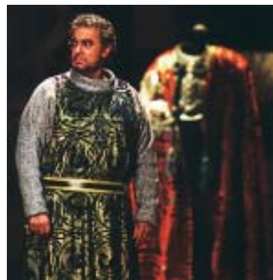
Sopra: Plácido Domingo è Otello, nel 1976, per la prima opera scaligera interamente ripresa dalle telecamere (immagine tratta da M. G. Forlani, Il Teatro alla Scala e la televisione )

Sono interrogativi che ci si pone assistendo all'edizione de La pietra del paragone di Gioacchino Rossini, con cui il Teatro Regio di Parma ha inaugurato la propria stagione e adesso in scena (sino a domani, 28 gennaio) al Théâtre du Châtelet di Parigi, prima tappa di una possibile tournée europea (e non solo) anche a ragione di un allestimento semplice (pur se molto tecnologico). Non è certo la prima volta che televisione e lirica cercano un connubio. L'ultima opera di quello scavezzaccolo settantenne che era Igor Stravinskij (forse il musicista più originale di tutto il Novecento), The Flood - "Il diluvio universale" - è stata commissionata da una rete televisiva, la Cbs, con l'intento di essere eseguita soltanto in video e in bianco e nero (si era nel 1962), con un breve intervallo tra i due divertenti e corti atti per dare spazio alla pubblicità di uno shampoo per capelli, la cui azienda sponsorizzava l'intrattenimento. Non sono mancati anche in Italia casi